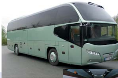
Neoplan 49+1 Sitze 4 Sterne Reisebus Baujahr 2007, WC, Klima, Bordküche, Mikro, DVD