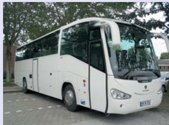
Scania Irizar 49+1 Sitze 3 Sterne Reisebus Baujahr 2009, WC, Klima, Bordküche, Mikro, DVD