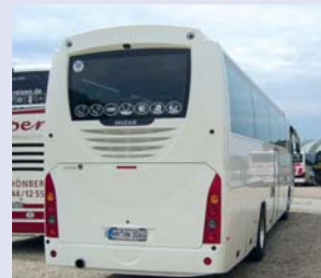
Scania Irizar 57+1 Sitze 3 Sterne Reisebus Baujahr 2009, WC, Klima, Bordküche, Mikro, DVD