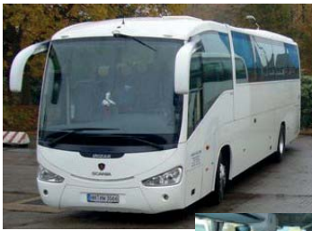
Scania Irizar 44+1 Sitze 4 Sterne Reisebus Baujahr 2007, WC, Klima, Bordküche, Mikro, DVD